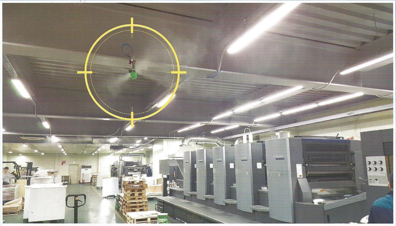
현장 설치 예